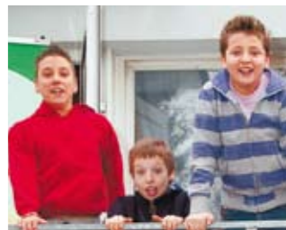
Freudensprünge am Grünanger.