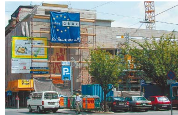
EU-Mittel ermöglichten auch die Sanierung des „Bades zur Sonne“.