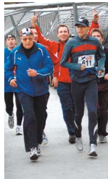
... und zuerst über die Murinsel.