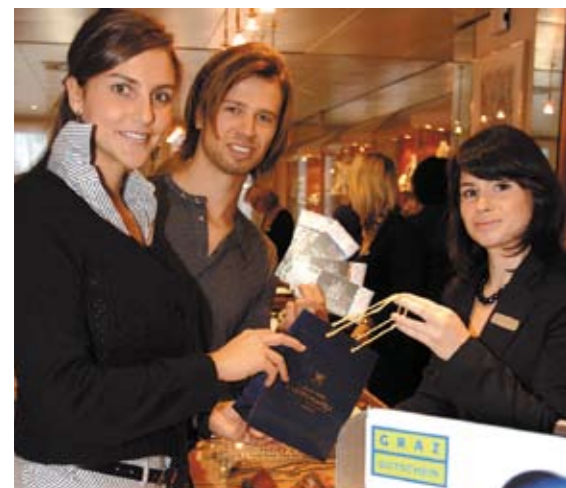
Oder wollen Sie lieber mit GrazGutscheinen Freude machen? Auch die kann man auf dem Hauptplatz erstehen – und bei Graz Tourismus, Herrengasse 16.

Donnerstag, 2., bis Freitag, 10. April: 10 bis 18 Uhr Samstag, 11. April: 10 bis 14 Uhr