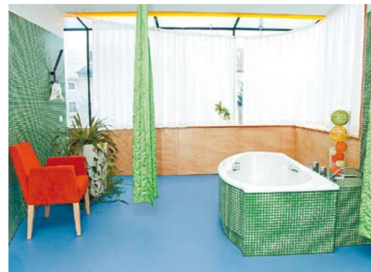
Umfassendes pflegerisches und medizinisches Angebot nach den individuellen Bedürfnissen der PatientInnen.

Das Angebot ist kostengünstig (Info-Kasten) und dank eines Fahrdienstes zu bewältigen. Die Patienten müssen gehfähig sein oder zumindest mit einem Rollstuhl fahren können.