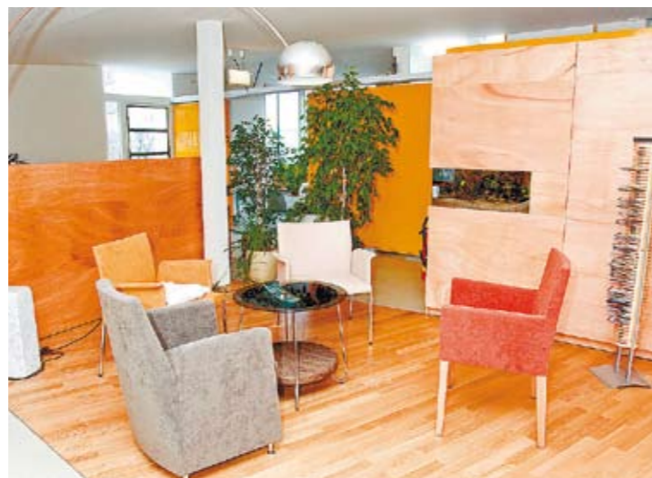
Modern, freundlich, warm: Tagesgäste im Hospiz erwartet eine sehr angenehme Atmosphäre.