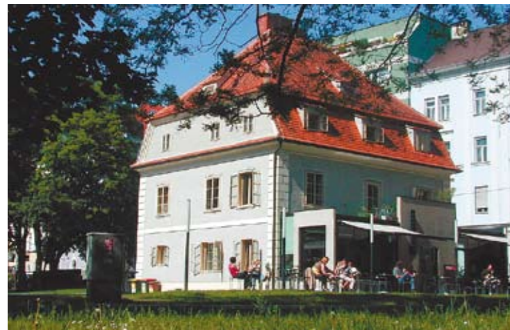
... wurde ein Schmuckkästchen und interkultureller Treffpunkt.