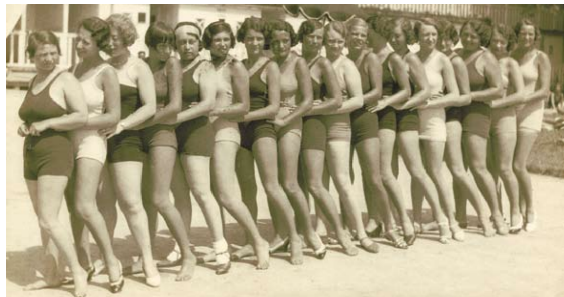
Badeschönheiten im Gruppenbild (30er Jahre).

Als 1959 die Ehrengalerie im zweiten Burghof in der Burg mit Porträtbüsten von steirischen Prominenten