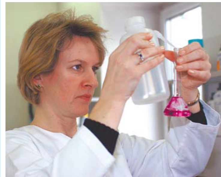
Wächterin über die Grundlage allen Lebens an der Arbeit.

Wer Wasser aus seinem Hausbrunnen untersuchen lassen will, kann die Dienste des Wasserlabors werktags von 7 bis 15 Uhr in der Wasserwerksgasse 10 in Anspruch nehmen. Die einfache chemisch-bakteriologische Analyse kostet 122 Euro. Bitte zuvor die Anleitung zur Wasserentnahme unter Tel. 887-10 73 einholen.