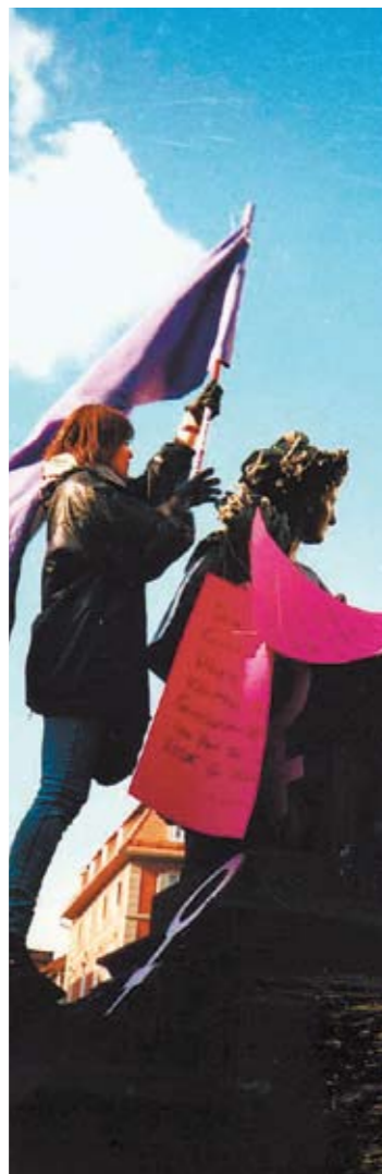
Aktion zum 8. März.

Frauen zu stärken, sich für ihre Bedürfnisse einzusetzen und ihre Anliegen umzusetzen, ist Ziel des Frauenreferats der Stadt.