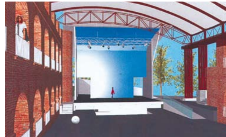
Historische Kulisse, aufgewertet mit modernster Technik: Kasematten.

gewertet zu haben. Die Bühne mit den neu geschaffenen Garderoben, Orchestergraben und den technischen Möglichkeiten entspricht damit den aktuellen Anforderungen für unterschiedlichste Veranstaltungen!“