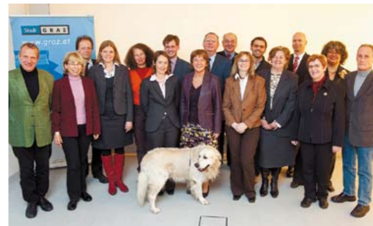
Gruppenbild mit Hund: der neue BürgerInnenbeteiligungsbeirat.