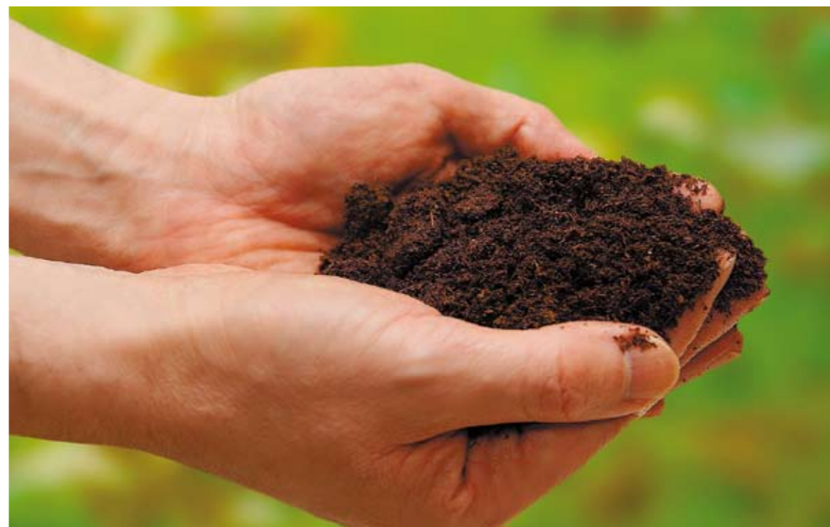
Osterfreuden im Garten: Humus

Informationen über eine sinnvolle Verwertung von Grünschnitt und verwandte Themen finden sich auf der Homepage www.oekostadt.graz.at des Grazer Umweltamtes, dessen