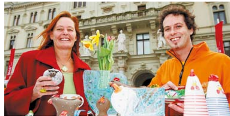
Kunstvolles Handwerk als Ostergeschenk? Gibt's auf dem Hauptplatz!