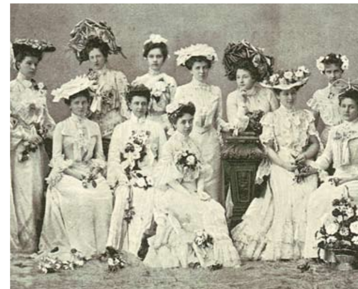
Damen der Gesellschaft beim Frühlingsfest 1903.