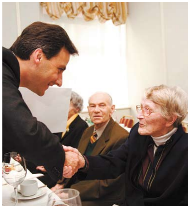
Gratulation! Die Stadt Graz ehrt ihre älteren BürgerInnen.

Parteienverkehr: Mo-Fr: 8 bis 18 Uhr und nach telefonischer Vereinbarung Alle Konsulate in Graz finden Sie auf www.graz.at/konsulate Nächste Folge: Georgien