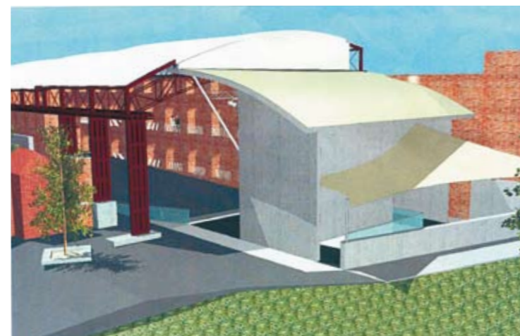
Die Kasematten-Bühne wurde um 180 Grad gedreht.