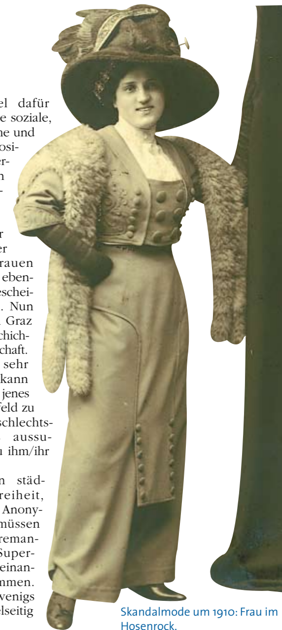
Skandalmode um 1910: Frau im Hosenrock.

ein Beispiel dafür sein, dass die soziale, wirtschaftliche und politische Position der überwiegenden Zahl an Männern in der Geschichte zwar besser als jene der meisten Frauen waren, aber ebenfalls recht bescheiden blieben. Nun leben wir in Graz in einer vielschichtigen Gesellschaft. Zumindest sehr theoretisch kann man(n?) sich jenes soziales Umfeld zu seinem Geschlechtsverständnis aussuchen, das zu ihm/ihr passt. Im Rahmen städtischer Freiheit, die oft nur Anonymität ist, müssen auch Supermännchen und Supermännchen miteinander auskommen. Oder sich wenigstens wechselseitig ignorieren.