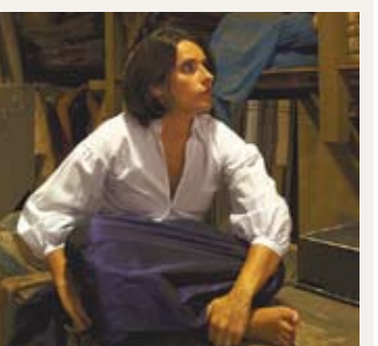
Fado-Sängerin Cristina Branco.

Die im Herbst 2008 gegründete Trägerorganisation steht für 450 Veranstaltungen unterschiedlichster Genres im Orpheum, im Dom im Berg und auf der Schloßbergbühne Kasematten, mehr als 200.000 BesucherInnen, jährlich starke Vernetzung in Graz, der Steiermark, Österreich und gezielte internationale Projekte. Nähere Infos unter www.spielstaetten.at .