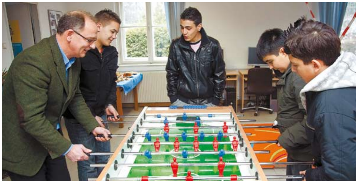
Immer am Ball: die Jugendzentren – hier die Eröffnung in Grünanger

„Es gibt bei uns kein Jugendzentrum, in dem nicht die Jugendlichen selbst etwas gemacht hätten, ob Innenausbau, Möbelbau, Wände versetzen oder Graffiti. Auch Mädchen sind sehr aktiv: In einem Zentrum haben sie sich einen Mädchenraum gemacht und gemauert, gemalt und verfliest. Der Raum bestand einige Jahre, und jetzt ist er wieder weg. Denn das Ganze ist natürlich sehr lebendig, so wie die Jugendlichen selbst.“