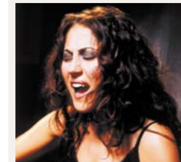
Aynur live in den Kasematten.

Am 15. und 16. Mai ist es soweit: Die Eröffnung der neuen Schloßbergbühne Kasematten wird mit zwei ganz besonderen kulturellen Höhepunkten gefeiert: Türkische Nacht Freitag, 15. Mai, 20 Uhr Eine beeindruckende Türkische Nacht ist garantiert: Aynur, die erste Künstlerin, die in einem türkischen Film live kurdisch sang, bringt Klän-