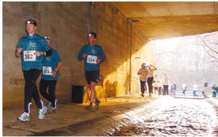
„Der dritte Mann“ lässt grüßen: Beim Kanallauf geht's tatsächlich durch den Untergrund ...