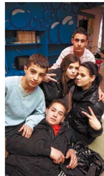
Cool, das neue Jugendzentrum!

Eiselsberg gemeinsam mit den Betreibern von WIKI eröffnete. Nachdem die mobilen Container am Liebenauer Grünanger schon aus allen Nähten platzten, wurde ein zusätzlicher Standort gefunden. Bis 2006 wurde in der Schützensgasse 16 getrommelt und gespielt, seither wird am neuen