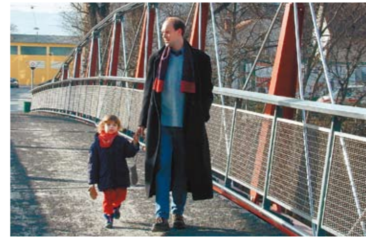
Urban Gries: Stadt und EU gingen Hand in Hand zum Augartensteg.

wirken. Ohne die Errichtung einer GKB-Bahnunterführung in der Alten Poststraße – gefördert aus Mitteln des Programms Urban_Graz West – könnte die laufende Entwicklung eines ganzen neuen Stadtteils auf den Reininghaus-Gründen nicht stattfinden. Das Urban-Pilotprojekt e.l.m.a.s. brachte vor allem Akzente für die Umgebung des Augartens, Urban_Graz-Gries und Urban_Graz West waren Auslöser für nachhaltige Investitionen der Stadt und der EU sowie „Zündschnur“ für zahlreiche private Initiativen im Umfeld. Einige Beispiele für EU-geförderte Projekte dieser Programme finden Sie in den Info-Boxen unten. Insgesamt sind bisher rund 17 Millionen Euro an EU-Geldern für laufende und abgeschlossene EU-Programme von Brüssel nach Graz geflossen. Doch damit ist noch lange nicht Schluss: Die Stadtbauverwaltung und ihr EU-Referat verlegen bereits die Leitungen, die aus den nächsten EU-Programmen Geld der Europäischen Union in die Grazer Kassen spülen und somit bleibende Spuren in Graz hinterlassen werden.