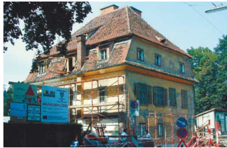
„Zauber“ à la e.l.m.a.s.: Aus dem baufälligen Marienschlössl...